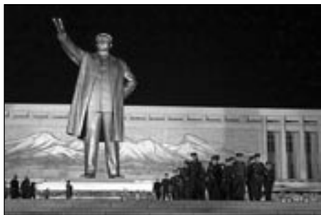
Stalinistický kult osobnosti: Kim Ir-sen jako „bůh otec“.

Severní Korea zahájila jejich stavbu koncem 80. let v souvislosti s olympiádou v jihokorejském Soulu, což ji donutilo alespoň částečně otevřít hranice. Kromě zahraničních hostů byl do kostelů dovolen vstup jen naprosto spolehlivým a loajálním občanům.