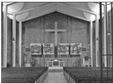
Kostel Paula Gerhardta v Mnichově, kde se konala Výroční konference CSI