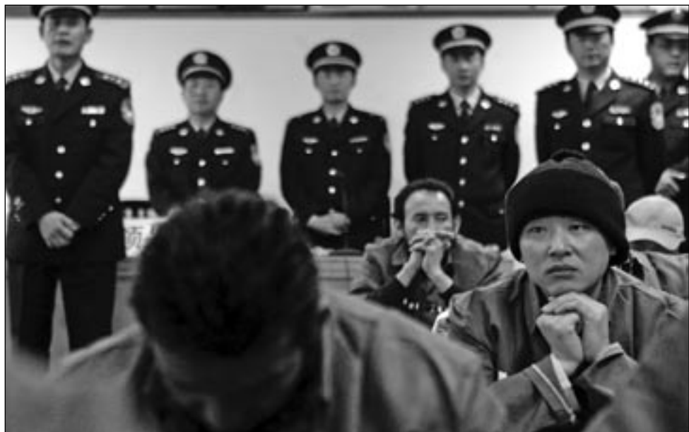
Modlíci se křesťané v šanghajském vězení Quingpu.