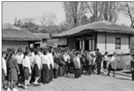
„Pout“ studentů k domu, kde se narodil Kim Ir-sen. (PD)

Amnesty International a Mezinárodní společnost pro lidská práva (International Society for Human Rights) odhadují, že je v Severní Koreji vězněno asi 200 tisíc lidí. Je mezi nimi mnoho křesťanů, kteří uprchli do Číny a byli podle zákonů této komunistické sousední země donuceni k návratu zpět do